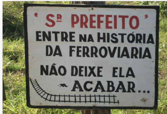
Foto 7: Reivindicação dos moradores do bairro Elihu Root(08/12)

sejam apagadas, mas que possam contribuir para o desenvolvimento e construção de um futuro melhor para todos.