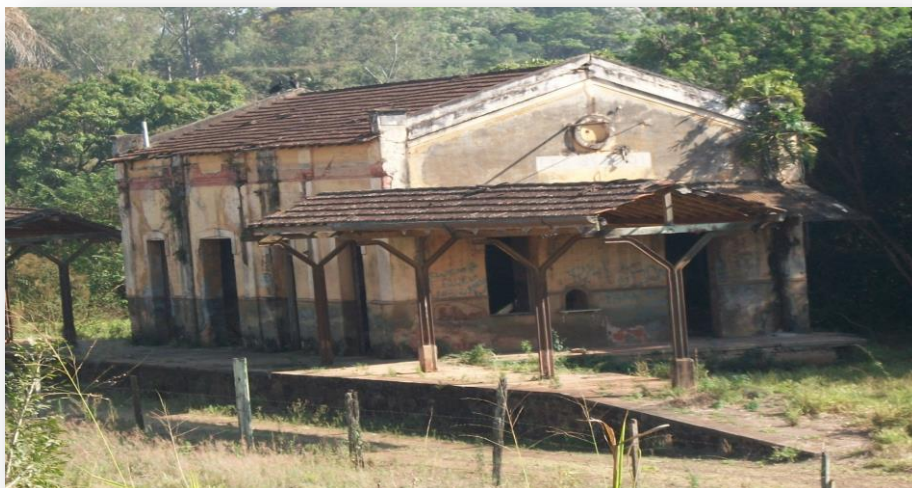
Foto 3: Antiga estação ferroviária Elihu Root

O nome da antiga estação ferroviária Gabiroba é alterado para Elihu Root, o bairro também recebeu seu nome, uma homenagem ao advogado e Secretário Norte Americano.